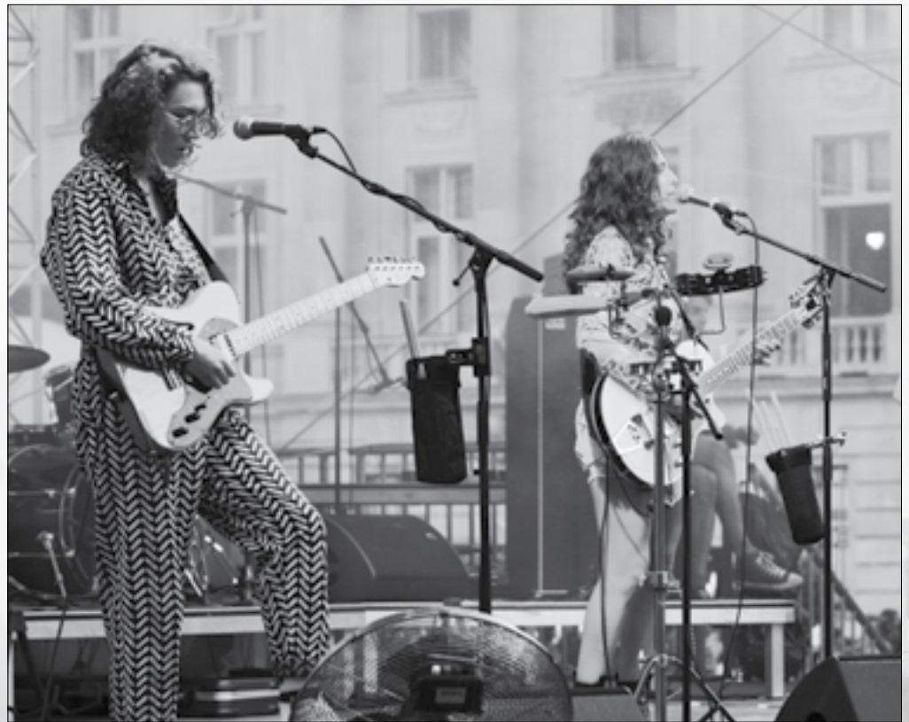
Spielen am Sonntag auf der RB-Stage in Nickelsdorf: Friedberg

Was sich sonst noch bis zum Herbst tut, wer am Sisters Festival und am Frequency spielt, erfahrt ihr in den nächsten alszeilen .