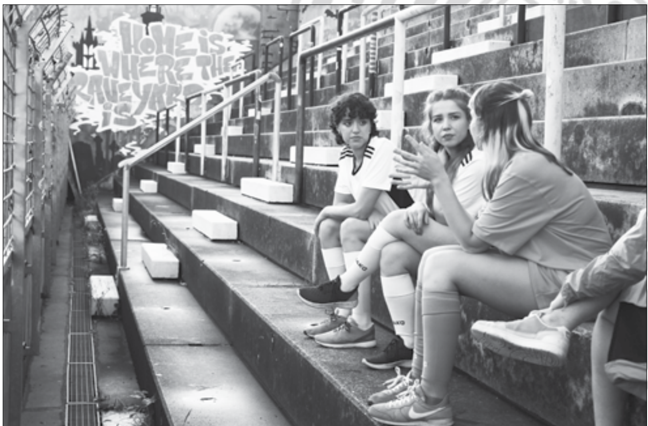
Letzte Vorbereitungsbesprechung vor dem Dreh auf der Friedhofstribüne.