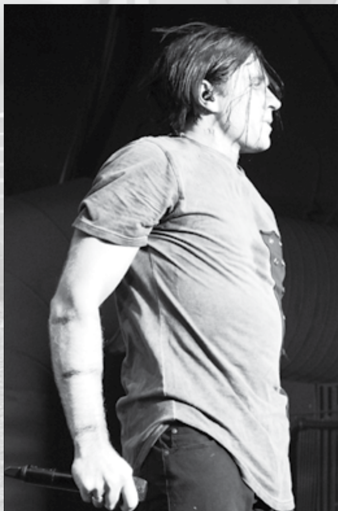
Matt Walst und Three Days Grace sind Freitag am Nova Rock

VIENNA, BRATISLAVA, SKOPJE, ASTANA, RAS AL KHAYMAH, DUBAI, ISTANBUL, PRAGUE