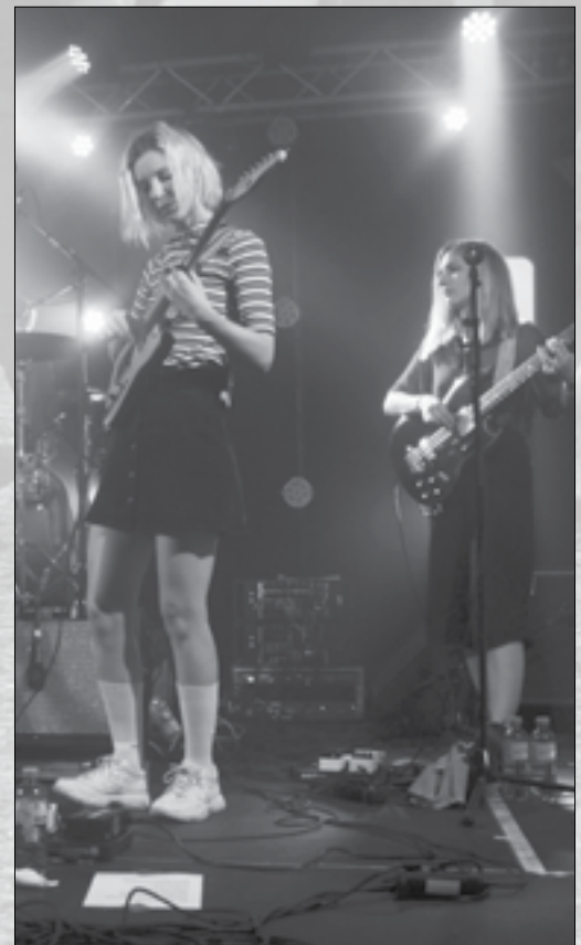
Spielen beim Lido Sounds: My Ugly Clementine