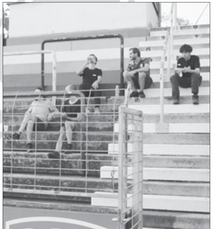
Drehpause auf der fht.