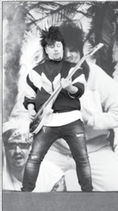
Auch am Nova Rock zu sehen: Electric Callboy